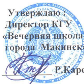
График государственных экзаменов в 12 а,б,в – классов КГУ «Вечерняя школа города Макинск отдела образования Буландынского района управления образования Акмолинской области» на 2023-2024 учебный год